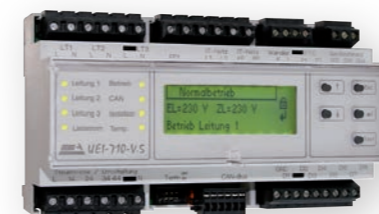
Multifunktionales Umschalt- und Überwachungsgerät UEI-710-V.5