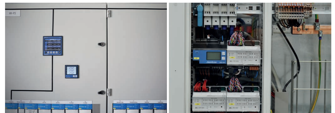
Schaltanlagen nachgerüstet mit Geräten zur Verbrauchsdatenerfassung

Lassen Sie sich beraten. Auf Wunsch führen wir Ihnen in unserem Haus ein funktionierendes Energiemanagementsystem vor. Kontaktieren Sie unsere Hotline unter 03437-9211-590.