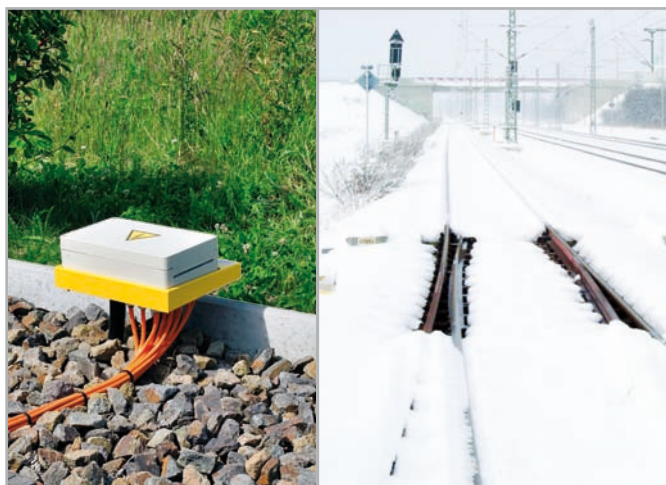
Anschlusskasten mit RCM – Isolationsfehlersuchgerät und beheizte Weiche bei Schnee