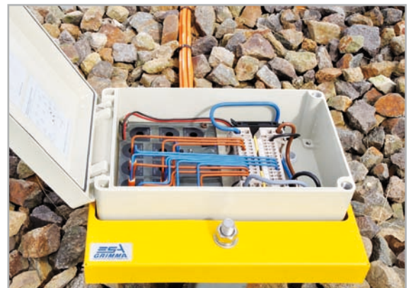
Anschlusskasten mit Isolationsfehlersuchgerät RCM