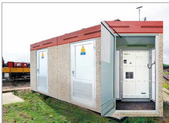
Beispielabbildung einer Trafostation mit Netzersatzanlage nach der Fertigstellung